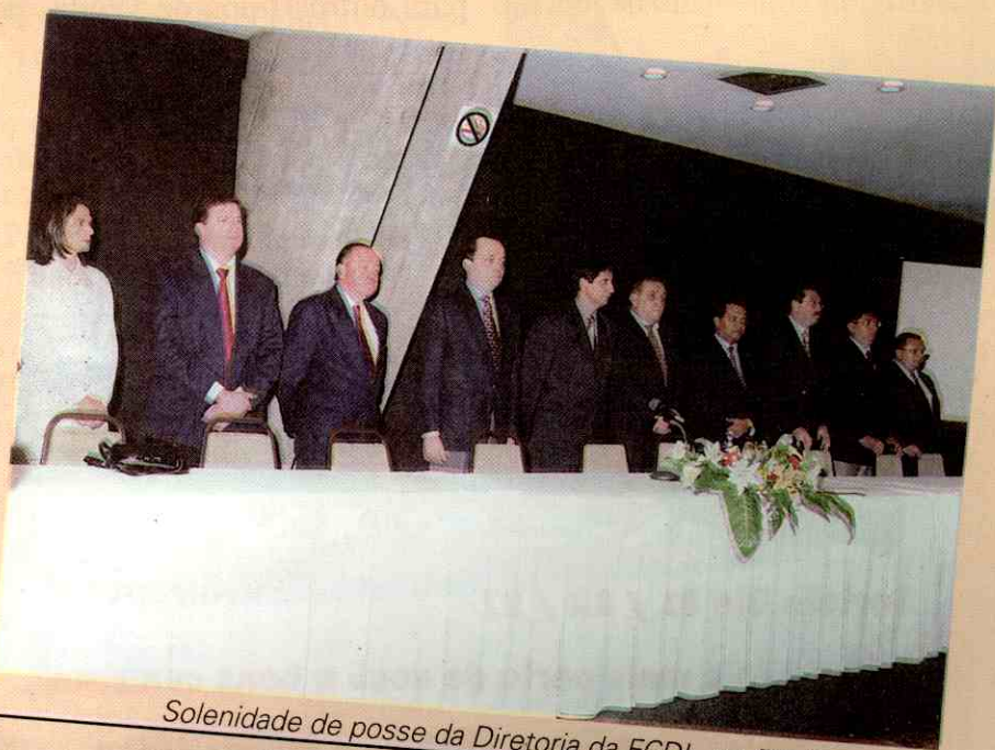
Solenidade de posse da Diretoria da FCDL, no Rio Poty Hotel