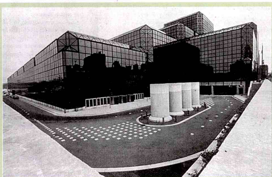
Jacob K. Javits Convention Center, em Nova York