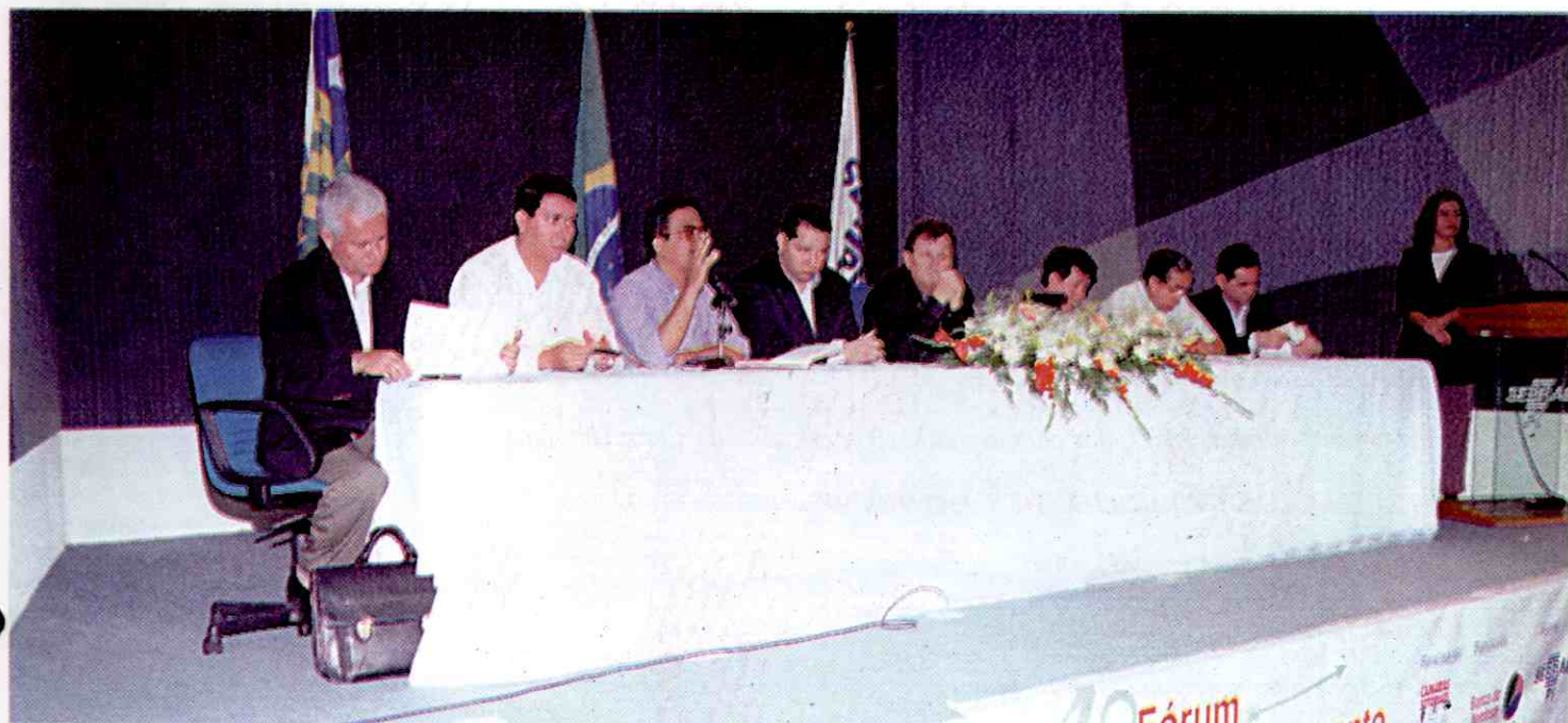
O Fórum reuniu autoridades e profissionais da Economia e Administração